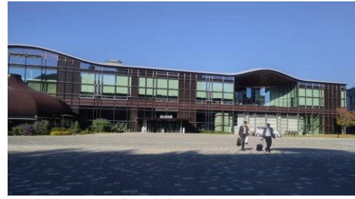
ぎふメディアコスモス

初日に昼食後まず岐阜市の中心部にある岐阜市役所を訪れ、かなり大きな市役所の建物の中心部を案内されて通過し、その裏側にある図書館と市民活動交流センター、ギャラリー、ホール等が一体となった複合施設の「ぎふメディアコスモス」へ案内され