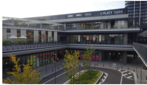
『プラティ多治見』駅南口ペDESTリアンデッキ直結

へ戻る過程でよくよく見ると、将来的にこの駅北庁舎に隣接して多治見市役所が移転されてくるのがよくわかりました。将来的には市役所は多治見駅に隣接