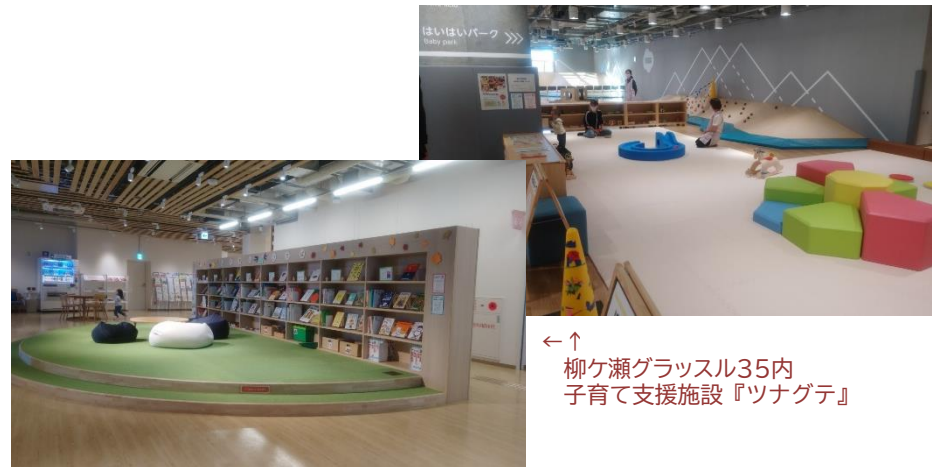
← 柳ヶ瀬ガラス35内 子育て支援施設『ツナグテ』

この地区はJR岐阜駅から北へ約1kmの柳ヶ瀬商店街でにぎわいの中心であったが、次々にできる郊外のショッピングモールの影響で、大型商業施設が相次いで撤退、さらに建物の老朽化や後継者の問題などで衰退していききました。そこへ高島屋南地区第一種市街地再開発