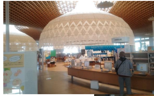
↑→ ぎふメディアコスモス内『市立中央図書館』

ました。まずは市役所とその附属の建物が大敷地に建っており、まずそれに度肝を抜かれました。広い敷地の後ろに建つ、ぎふメディアコス