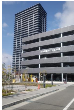
多治見駅隣接の立体駐車場

へ戻る過程でよくよく見ると、将来的にこの駅北庁舎に隣接して多治見市役所が移転されてくるのがよくわかりました。将来的には市役所は多治見駅に隣接